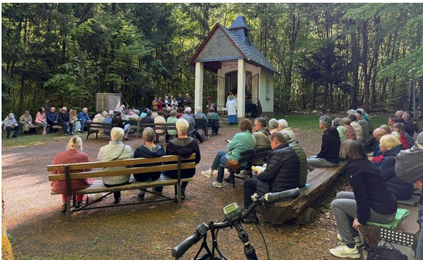
Eröffnung des Maimonats an der Waldkapelle in Kisselbach

Ein Taizé-Gesang schuf einen ruhigen, fast meditativen Moment, bevor der Gottesdienst wieder in die Lebendigkeit der Kirmes überging. Und spätestens beim Schlusslied – dem legendären Benzweiler „Hahnenlied“, der inoffiziellen Nationalhymne des Ortes – war klar: Hier feiert ein Dorf nicht nur Kirmes, sondern Gemeinschaft. Eine Kirchenbesucherin brachte es nach dem Gottesdienst auf den Punkt: „ Das war eine Zeitenwende. “ Gemeint war nicht ein Bruch mit Tradition, sondern ein Aufbruch: Kirche, die aus der Mitte der Menschen entsteht, nicht aus der Verwaltung. Kirche, die Mut macht. Kirche, die Zukunft hat. Nach dem Schlussegnen blieben viele noch lange stehen. Es wurde gelacht, erzählt, erinnert, geplant. Man spürte: Dieser Gottesdienst war nicht nur ein Programmpunkt der Kirmes – er war ein Moment echter Verbundenheit. Ein Zeichen dafür, dass Kirche lebendig sein kann, wenn Menschen sie leben. Und vielleicht hat der Hahn an diesem Morgen nicht nur gekräht – sondern Zukunft gerufen.