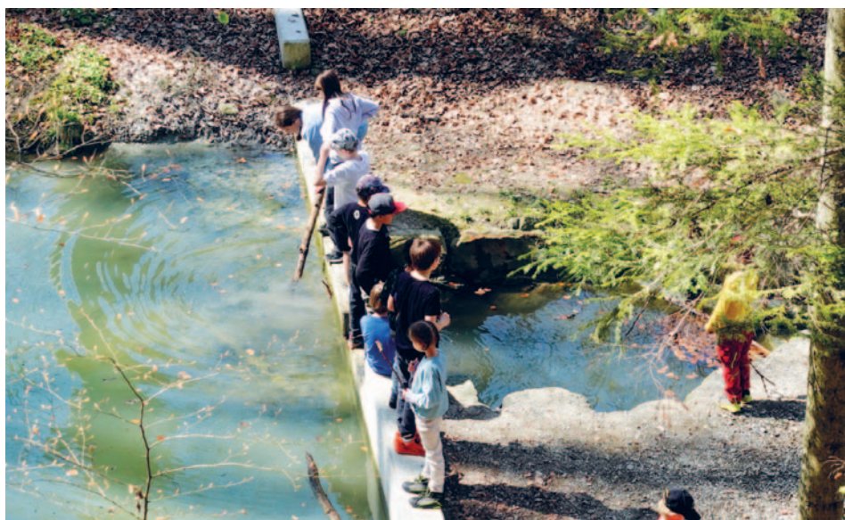
Kinderbibellager im kath. Pfarreizentrum