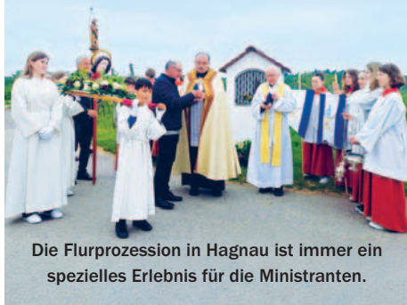
Die Flurprozession in Hagnau ist immer ein spezielles Erlebnis für die Ministranten.

Wir laden alle herzlich zur Teilnahme ein.