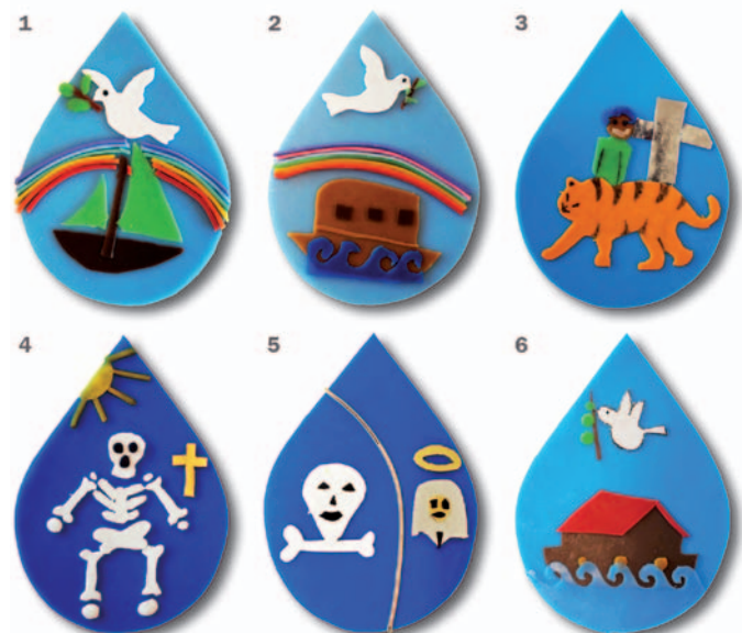
Die Sujets auf der Osterkerze in der Pfarrkirche

Dian (4) und Siro (5) – Neues Leben für alte Knochen: Wir mögen die Geschichte, weil sie cool ist, weil die Toten wieder auferstehen. Sophie (6) – Arche Noah: Ich mag die Geschichte, weil viele Tiere vorkommen und weil mein kleiner Bruder Noah heisst.