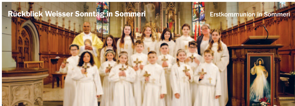
Erstkommunion in Sommeri