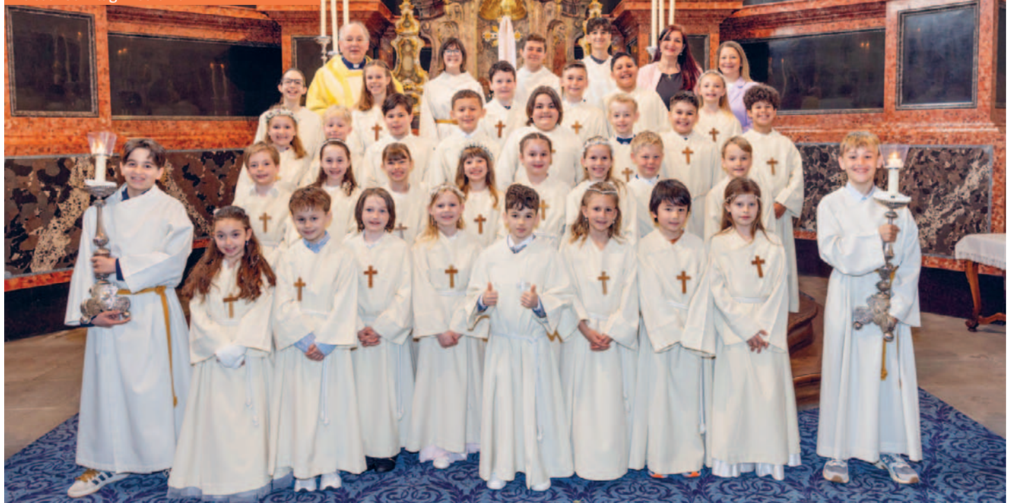
Weisser Sonntag in St. Ulrich