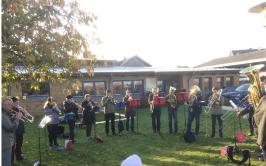
vor der Strandkirche 2018