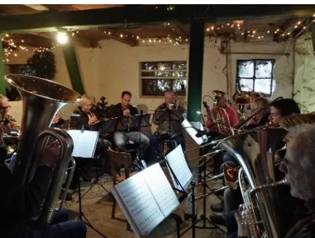
Advent in Kesdorf 2024

nach längerer Pause nun selbst im Posaunenchor mitspielen.