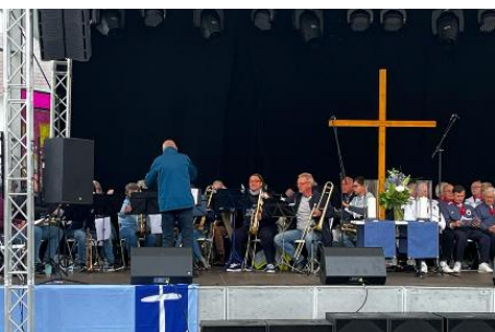
Sea Sunday Travemünde 2023