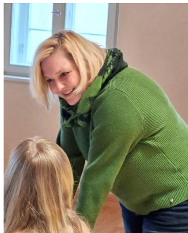
Im Gespräch mit den Jugendlichen beim Firmworkshop