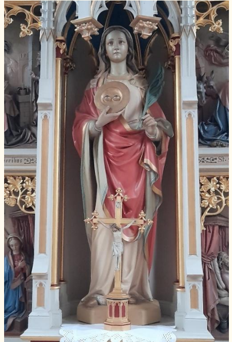
Statue der Hl. Lucia im Hochaltar der gleichnamigen Kapelle in Robringhausen

Alle Bilder, die nicht gesondert beschriftet sind, entstammen aus: Image, Pfarrbriefservice.de, pixabay, Erzbistum-Paderborn. Sie sind gemeinfrei und sind nur für die Verwendung im Pastoralen-Blick bestimmt.