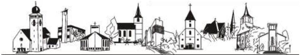
St. Laurentius Bretten St. Elisabeth Bretten St. Stephanus Diedelsheim St. Peter Bauerbach Heilig Kreuz Büchig St. Mauritius Neibshheim Guter Hirte Gondelsheim St. Martin Jöhlingen Maria Königin Wössingen