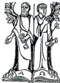
hll. Petrus u. Paulus