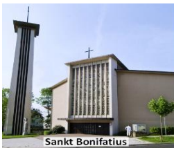
Ihringshäuser Str. 3

Ukrainehilfe der Malteser Kassel : Marburger Str. 87, Tel: 0561 - 8619142