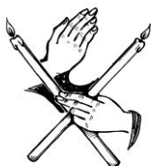
Illustration. buhv 35689

Sonntagvorabendmesse mit Austeilung des Blasiussegens (heute besteht die Möglichkeit mit dem Bonibus nach Dreieichenhain mitgenommen zu werden; Abfahrt: 17:15 Uhr Am Wilhelmshof 15 17:20 Uhr Eisenbahnstr.57)