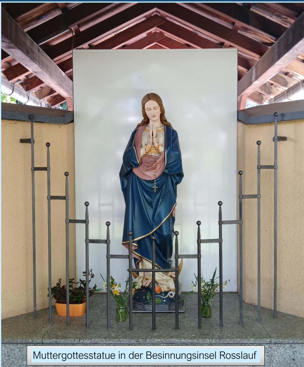
Muttergottesstatue in der Besinnungsinsel Rosslauf