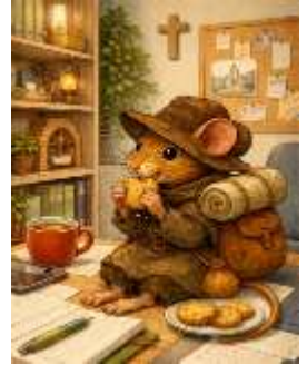
Bild Pilgermaus KI-generiert von ChatGPT