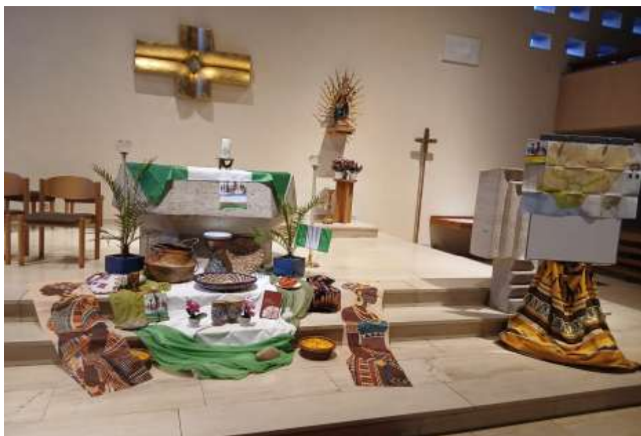
Ökum. Gottesdienst zum Weltgebetstag in der kath. Kirche Hallgarten; Foto: P. Maus

In Feilbingert und Hallgarten haben sich wieder Frauen getroffen, um den Gottesdienst zum diesjährigen Weltgebetstag mit dem Titel „Kommt! Bringt eure Last“ vorzubereiten. Gemeinsam wurden die Gottesdienste erarbeitet und die Räume gestaltet. Im Anschluss luden die Frauen zu Kaffee und Kuchen bzw. einem kleinen Imbiss mit selbstgemachten Speisen nach nigerianischen Rezepten ein. Vielen Dank an alle Helferinnen! Einen kleinen Eindruck können die Bilder auf dieser Seite bzw. auf der vorangegangenen Seite vermitteln.