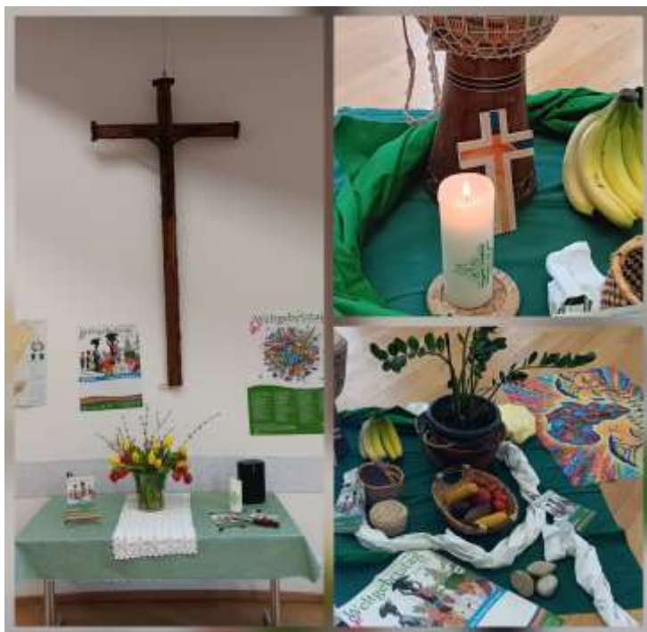
Ökum. Gottesdienst zum Weltgebetstag im Pfarrheim Feilbingert