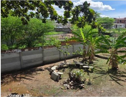
Die neue erstellte Mauer im Projektbereich Cedro