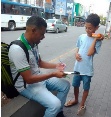
Kontakt mit Kind, das Süßigkeiten verkauft

über das Straßenkinderprojekt, Comviva in Caruaru, berichtet Beate Kästle Silva: Seit 1987 begleitet das Sozialprojekt COMVIVA, Gemeinschaft Leben, Kinder und Jugendliche in schwierigen Lebenssituationen im Nordosten Brasiliens. Viele von ihnen erleben Armut, Gewalt und soziale Ausgrenzung. COMVIVA setzt sich dafür ein, ihnen Schutz, Perspektiven und neue Hoffnung zu geben.