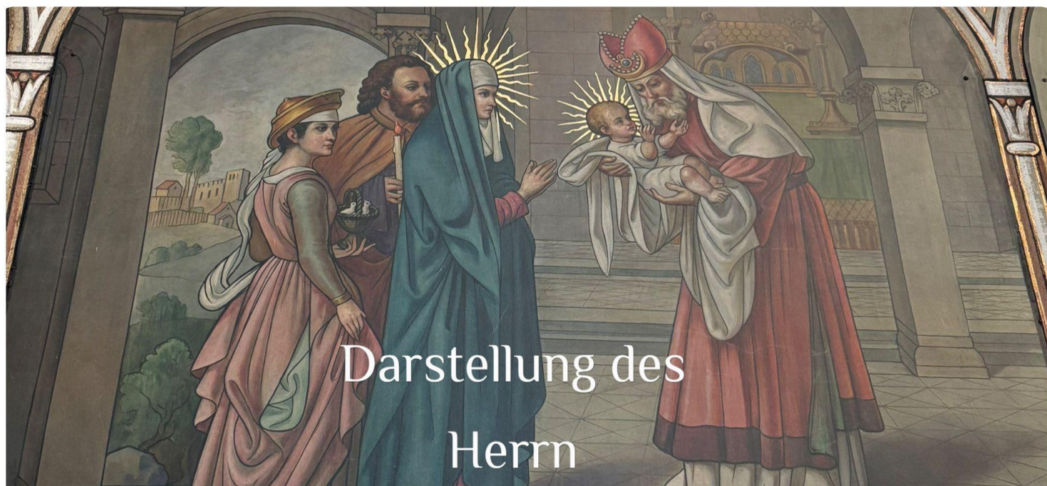
Darstellung des Herrn