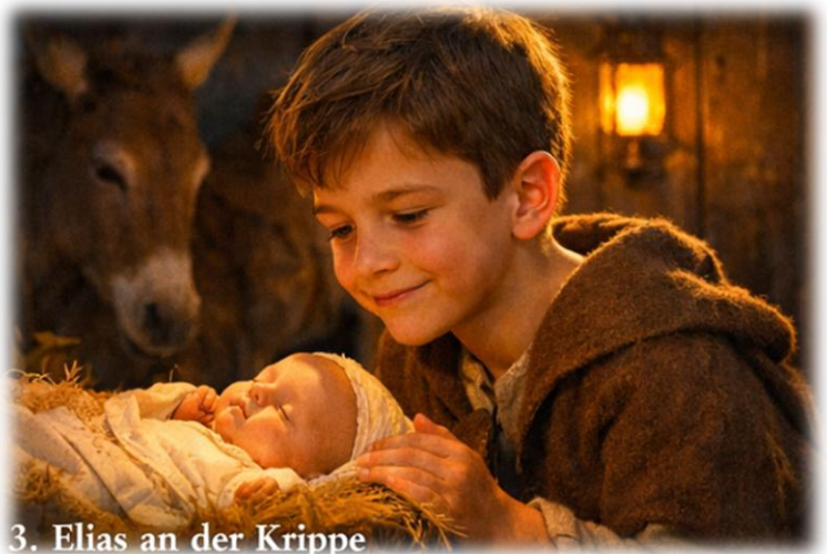
3. Elias an der Krippe