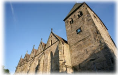
Die Stiftskirche Obernkirchen