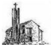
St. Bernward Nienburg