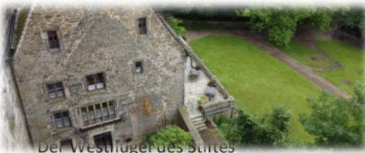
Der Westflügel des Stiftes