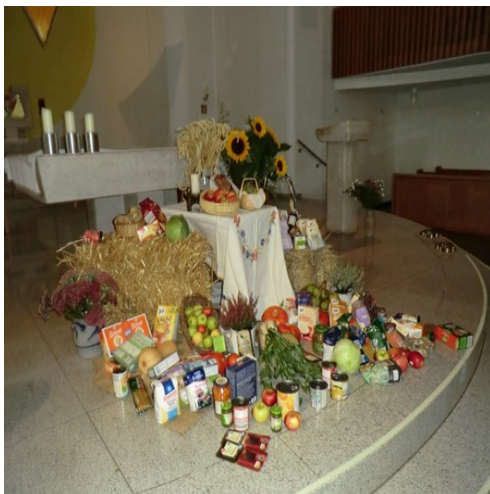
Erntedank-Altar / Gaben

Zu Beginn feierten wir Erntedank. Gemeinsam mit der anderen Kita und Mitgliedern unserer Gemeinde entstand ein liebevoll gestalteter Erntedankaltar. Die Eltern unterstützten uns dabei, indem sie verschiedene Gaben mitbrachten. So konnten die Kinder erleben, wofür wir dankbar sein dürfen und wie schön es ist, etwas miteinander zu teilen.