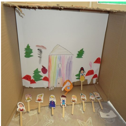
Selbstgebasteltes Figurentheater zum Thema Märchen - Schneewittchen und die 7 Zwerge

Ein echtes Highlight für die Kinder war unser Märchenfest. Im Otterbau tauchten wir in das Märchen „Frau Holle“ ein, während im Fuchsbau „Schneewittchen“ im Mittelpunkt stand. Mit viel Fantasie, Spiel und kleinen Aktionen wurden die Märchen für die Kinder lebendig.