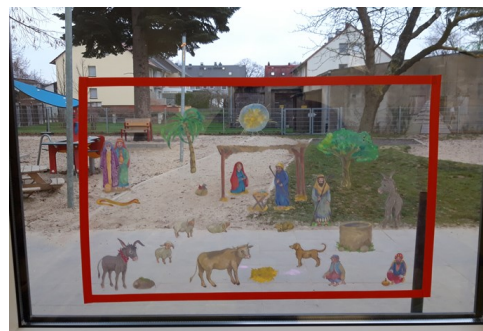
Elias der Esel erzählt die Weihnachtsgeschichte, dazu ein aufbauendes Fensterbild

Zusätzlich begleiteten uns in den Gruppen besondere Geschichten: Im Otterbau machte sich „Elias, der Esel, auf den Weg nach Bethlehem“, im Fuchsbau erzählte die Geschichte vom „Schaf Rica“. Mit jeder neuen Geschichte wurde auch das Fensterbild ein Stück vollständiger und ließ die Kinder den Weg zur Geburt Jesu Schritt für Schritt mitgehen.