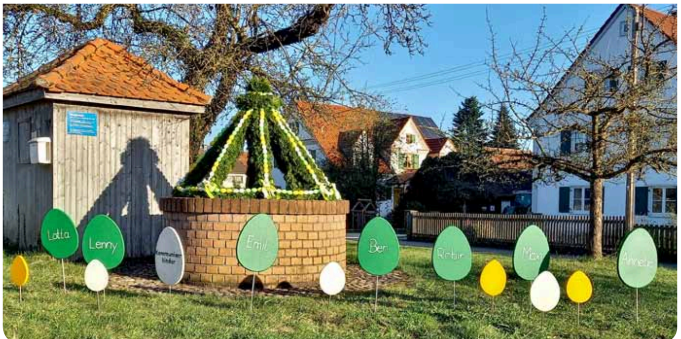
Einen sehr schön geschmückten Osterbrunnen gibt es auch heuer wieder in Baiershofen, Dank fleißiger Hände. Foto und Text: Sonja Klein