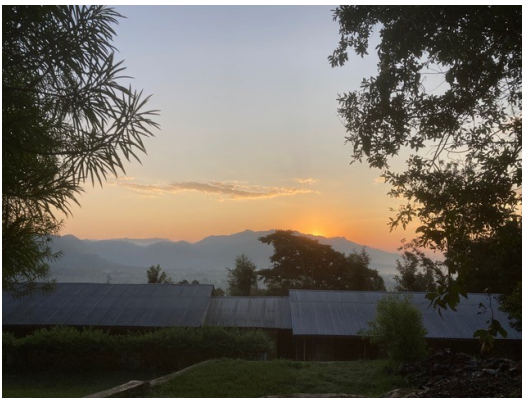
Sonnenaufgang über den Dächern des Kindergartens