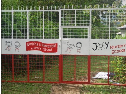
Der Eingang in den Kindergarten