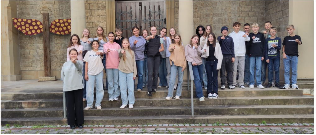
29 Konfis aus den 5 Kirchengemeinden Westheim, Eschenau, Oberhohenried, Römershofen, Haßfurt mit Hainert, Knetzgau, Unterschleichach, Sylbach, Obertheres

Die Konfirmationsarbeit in unserer Kirchengemeinde läuft inzwischen im Verbund von aktuell 5 Gemeinden. So werden die Jugendlichen auch vom 6.-8. Februar 2026 zusammen auf Konfifreizeit nach Altenstein fahren. Wir möchten das Jugendhaus des CVJM in unserem Dekanat nutzen und kennenlernen. So sparen wir Energie und tun etwas für unseren ökologischen Fußabdruck. Unabhängig davon werden sich Ende November die Kirchenvorsteherinnen und Kirchenvorsteher von 6 Gemeinden im