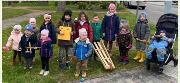
Ney, Foto: Kati Busch