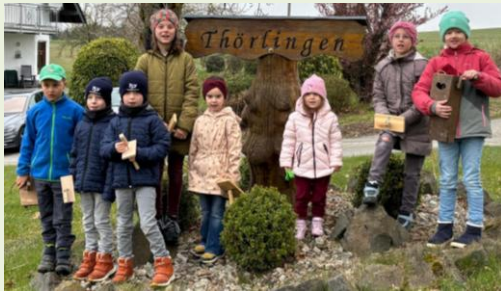
Thörlingen, Foto: Sandra Bartholmes