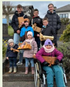
Obergondersh., Foto: Anke Arend