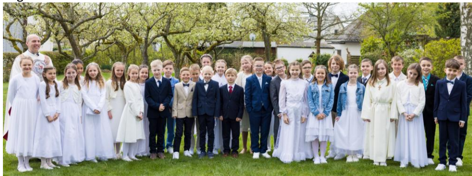
Emmelshausen, Foto: Florian Henrich

Die Erstkommunion Kinder und ihre Eltern bedanken sich bei allen, die die Kinder mit ihren Gebeten oder Gaben während der Vorbereitung und zu ihrem Festtag begleitet haben.