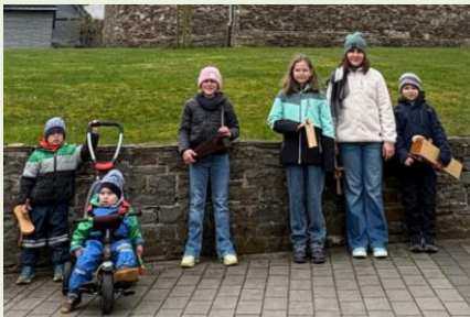
Sevenich, Foto: Marcus Becker