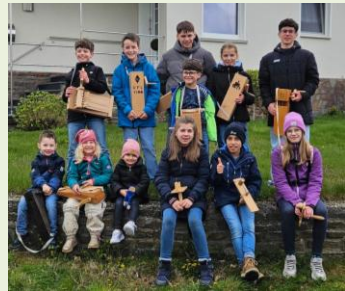
Niedergondersh., Foto: Kerstin Jakobs