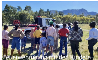
Feuerwehrübung mit den Kindern

Die große Elonwabeni-Familie besteht nicht nur aus den Kindern, Teenagern, Hausmüttern und allen Angestellten. Auch Pflegemütter und -familien, Kirchengemeinden, Fachkräfte und die persönlich miteinander verbundenen Menschen gehören dazu. Bei uns in Deutschland ist es ähnlich: ohne das große Netzwerk an Helfenden, Unterstützerinnen und Unterstützern und dem Freundeskreis von Elonwabeni könnte die KinderAIDShilfe hier nicht die Fülle an Aktionen und Veranstaltungen stemmen. Es sind die vielen Menschen, welche die gemeinsame Arbeit ermöglichen und bereichern.