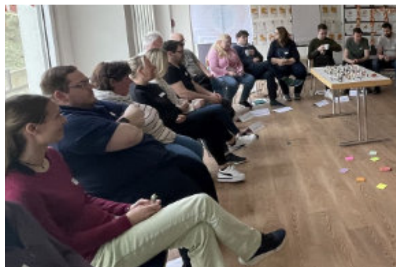
Bei der Klausurtagung des Pfarrerrates wurden viele Beschlüsse gemeinsam auf den Weg gebracht.

Die Arbeit soll stärker strukturiert und thematisch gebündelt werden. Dazu fasste der Pfarrerrat am Samstagnachmittag mehrere wegweisende Beschlüsse zur künftigen Arbeitsorganisation. Die bestehenden Themengruppen der Kirchenentwicklung 2030 sollen im Jahr 2026 zunächst in gewohnter Form weiterarbeiten, während parallel neue Strukturen aufgebaut werden.