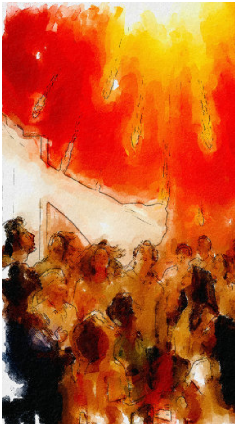
Grafik Albert Lachnit (Photoshop, Ki)

Und jetzt wird es unbequem: Wie gehe ich eigentlich mit dieser Beziehung um? Pflege ich sie? Nehme ich sie überhaupt wahr? Oder