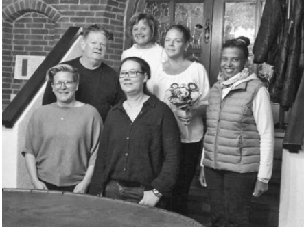
Die neue Vorstandschaft der Schalmeien.