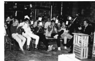
Probe im Obstlager