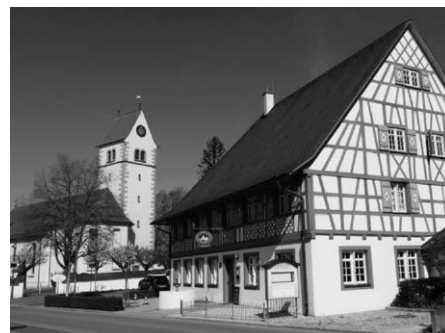
Heimatmuseum im Haus Montfort in Kippenhausen