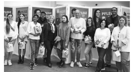
Elf der 15 Pflegekräfte, die sich für die Kampagne fotografieren ließen.

Die Kampagne wurde im Landratsamt Bodenseekreis durch die Kommunikationsabteilung und die Sozialplanung entwickelt – in Zusammenarbeit mit dem Netzwerk „Älter werden im Bodenseekreis“ sowie dem Fotografen Felix Kästle. Finanziert wird sie aus Fördermitteln des Landes sowie der Pflegekassen in Baden-Württemberg.