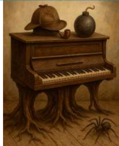
Ein gefährliches Klavierkonzert

Kinder, Jugendliche und Erwachsene spielen Klavierstücke von J. S. Bach, E. Grieg, J. Williams, H. Zimmer, H. Heines Lorelei, Madonna und vielen mehr! Anschließend Empfang mit Live-Musik. Eintritt frei | Spenden zugunsten von Kirchenmusik Links der Ruhr