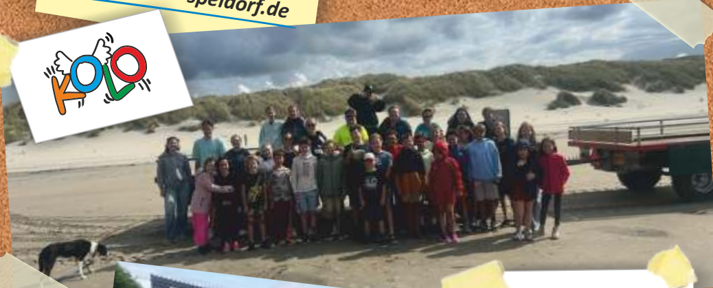
Kinderfreizeit Ameland 2025