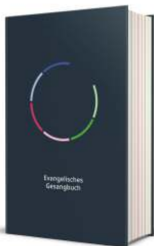
Das neue Gesangbuch ist gerade in der Erprobungsphase