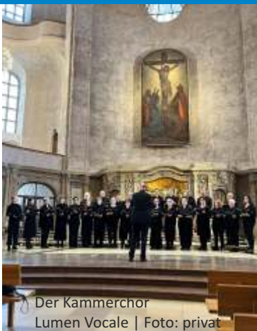
Der Kammerchor Lumen Vocale