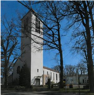
St. Marien Espelkamp