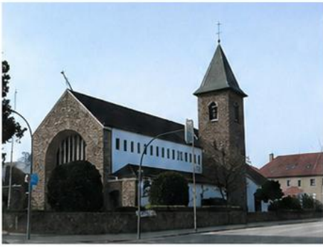
St. Johannes Bapt. Lübecke