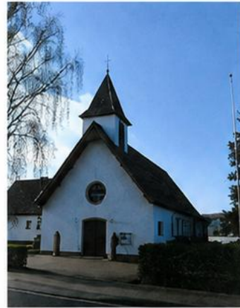
St. Michael Rahden

Vorstellung „Rat der Pfarreien“ 28.06.2026 mit einem gemeinsamen Gottesdienst um 15.00 Uhr in Rahden