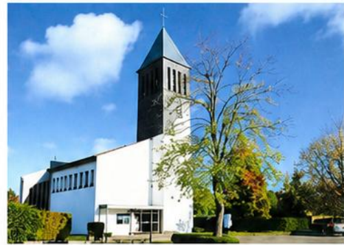
St. Raphael Pr. Oldendorf