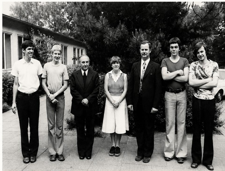
Der Vorstand der Kolpingfamilie Espelkamp zur Zeit der Gründung im Jahr 1976

Titelblatt des Programmheftes zur Gründungsfeier am 27. Juni 1976