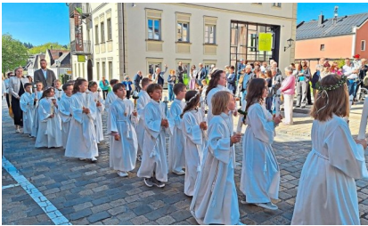
Bei strahlendem Sonnenschein zogen die Erstkommunikanten mit ihren Kerzen vom Pfarrheim in die Stadtpfarrkirche.