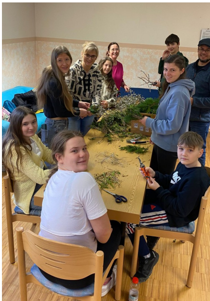
Eindrücke vom gemeinsamen Palmbuschbinden im Pfarrheim.

Auch in diesem Jahr haben die Ringelaier Ministranten – gemeinsam mit Eltern und weiteren Helfern – wieder gemeinsam Palmbüsche gebunden und Kuchen gebacken. Beides wurde am Palmsonntag gegen eine freiwillige Spende angeboten.