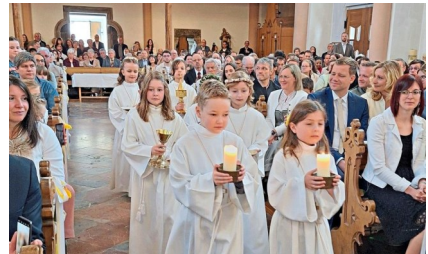
Beim Gabengang brachten Mädchen und Buben Kerzen, Brot und Wein zum Altar.