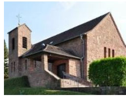
Unbefl. Herz Mariens Löhrbach