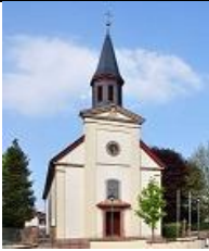
St. Bonifatius Ober- Abtsteinach