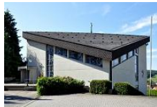
St. Marien Unter-Abtsteinach