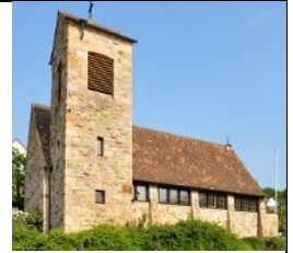
St. Michael Buchklingen