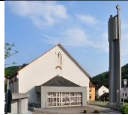
St. Wendelin UnterFlockenbach