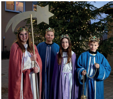
Brachten den Segen 2025 ins Bundeskanzleramt: Die Hopperstädter Anna, Tim, Emilia und Julius (v.l.n.r.).