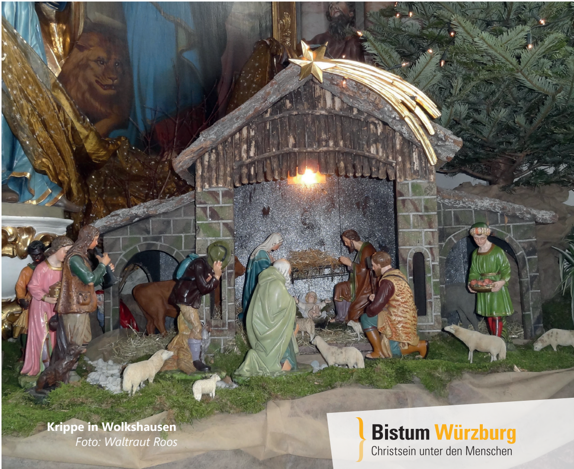
Krippe in Wolkshausen

Bistum Würzburg Christsein unter den Menschen