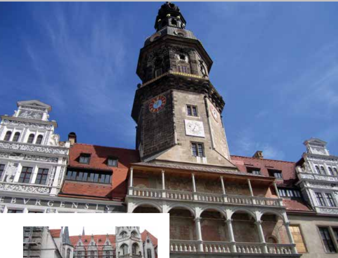
2001 - 2007 Residenzschloss Dresden