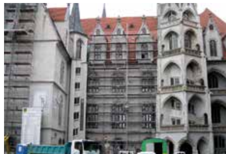
2017 Albrechtsburg Meißen

Ihr Partner, wenn es um Bauvorhaben im Großraum Dresden geht. Ob Neubau, Sanierung oder spezielle und anspruchsvolle Architektur. Wir realisieren.