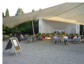
SCHLOSSPARK BAD SÄCKINGEN (unter dem Sonnensegel vor der Konzertmuschel)

Adelbergstraße 79618 Rheinfelden (bei der alten Zollbrücke)