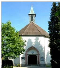
Pfarrkirche ST. PETER UND PAUL

Kirchen und Orte, an denen wir Gottesdienst feiern: