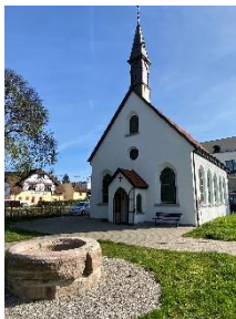
ST. JAKOBUS AM ADELBERG

Austraße 14 79713 Bad Säckingen (auf dem historischen Au-Friedhof)