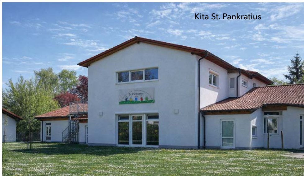
Kita St. Pankratius