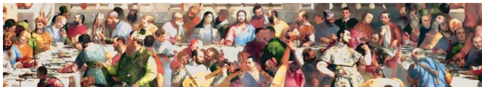
Bildausschnitt: „Die Hochzeit zu Kana“ von Paolo Caliari