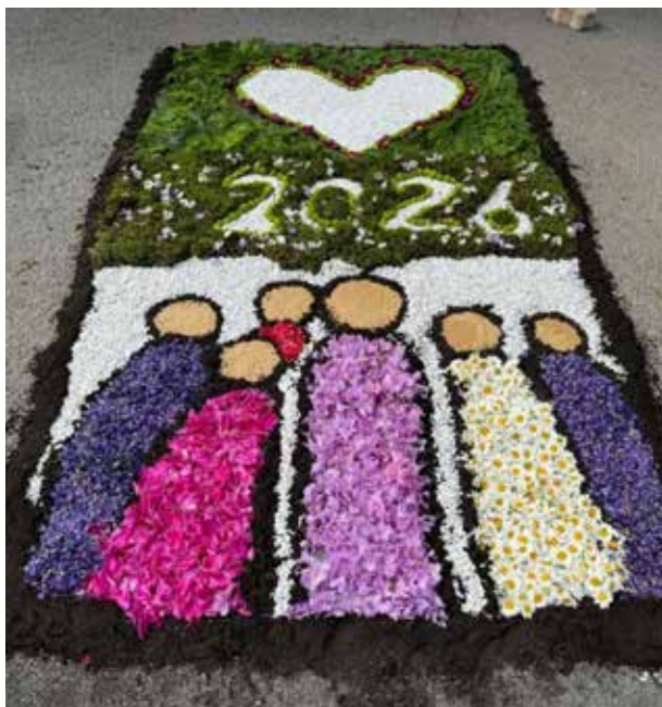
Blumentepich der Kommunionkinder in Fretter