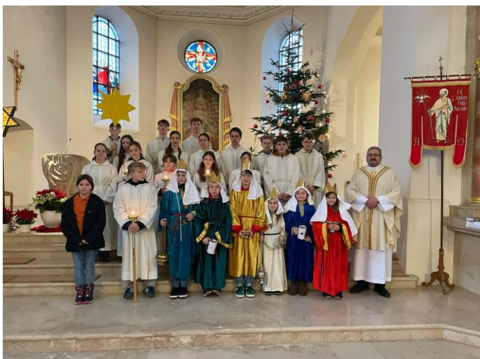
Sternsinger Edesheim 2026