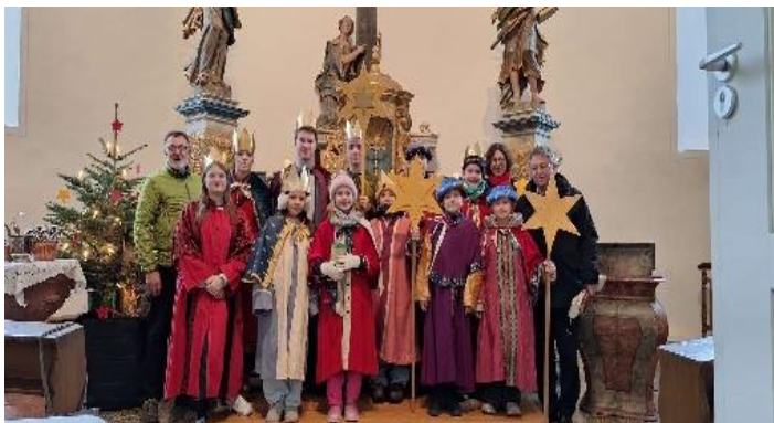
Sternsinger Edenkoben 2026