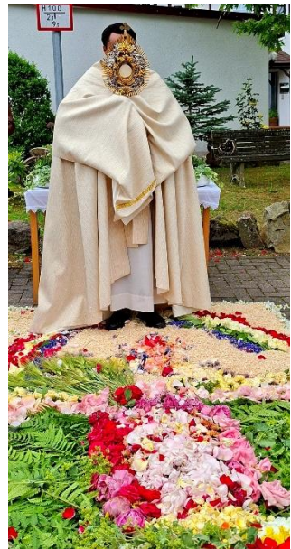
Text: M. Neuroth & Bilder: L. Kampschulte