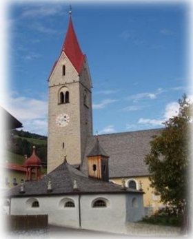
Pfarrei zum Hl. Rupert Spinges