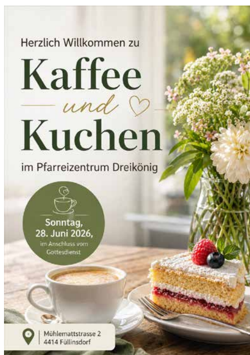
Flyer Pfarrrei Dreikönig

Am Sonntag, 28.06.2026 im Anschluss vom Gottesdienst. Herzlich Willkommen!