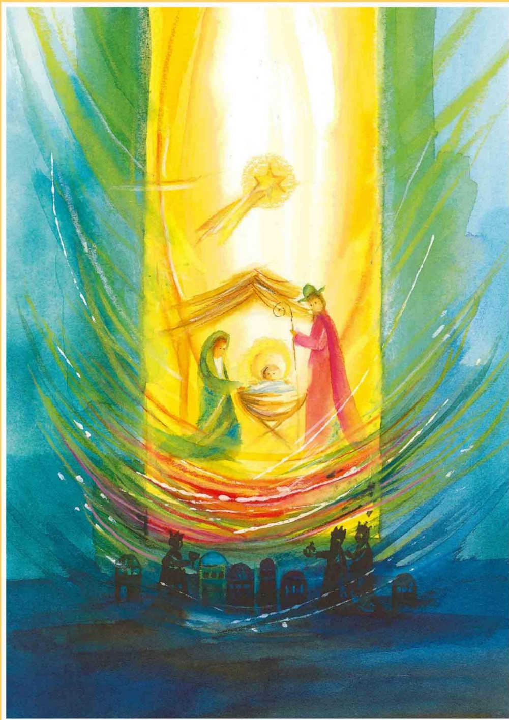
Pfarrbriefmantel - An der Krippe nie allein, Beuroner Kunstverlag