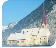
Eben- St. Notburgakirche