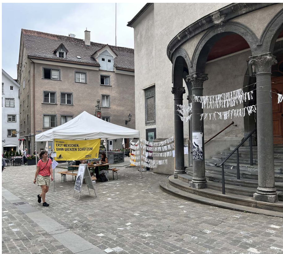
Die Fahnchen mit den Namen über dem Eingang der Martinskirche.

Am Freitag, 5. Juni, findet zudem im Kulturpunkt an der Planaterrastrasse 11 in Chur eine Tavolata, ein gemeinsames Essen mit Geflüchteten und Einheimischen, statt. Alle sind ab 18 Uhr eingeladen. Anschliessend treten geflüchtete Musikerinnen und Musiker aus der Ukraine, dem Iran und der Türkei an der Freitagabend-Bar im Kulturpunkt ab 19.30 Uhr auf. (pb)