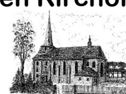
St. Laurentius Gieboldehausen