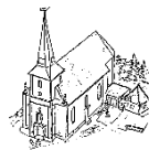
St. Matthäus Bodensee