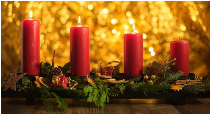
Foto: „3. Advent“ | Autor: Steven Kasa | Quelle und ©: www.pixabay.com | Herzlichen Dank!