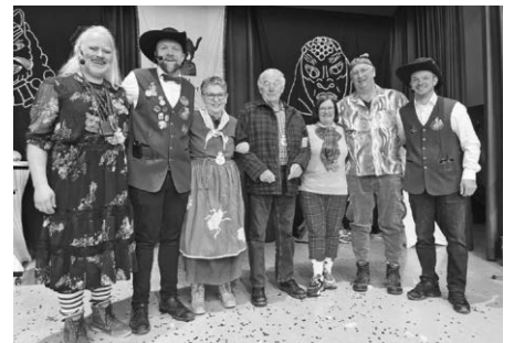
Neue Ehrenmitglieder unserer Zunft