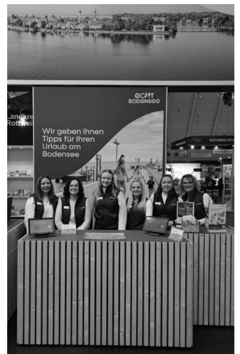
Vertreterinnen und Vertreter der verschiedenen Tourismusorte vertreten den Bodensee auf der CMT Stuttgart.

Ergänzt wurde der Messeauftritt durch den Lädinen-Verein, der sich am Samstag, den 24. Januar, auf der Aktionsfläche präsentierte, sowie durch die Gewinnerinnen und Gewinner des Bodensee-Wein e. V., die ebenfalls Teil des Messeauftritts waren.