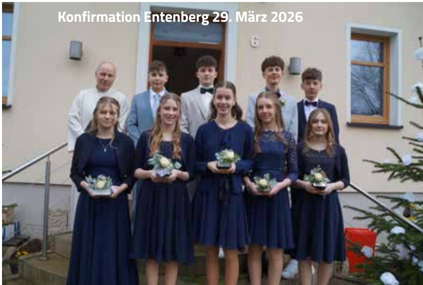
Konfirmation Entenberg 29. März 2026