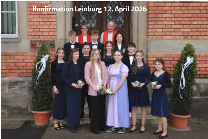
Konfirmation Leinburg 12. April 2026