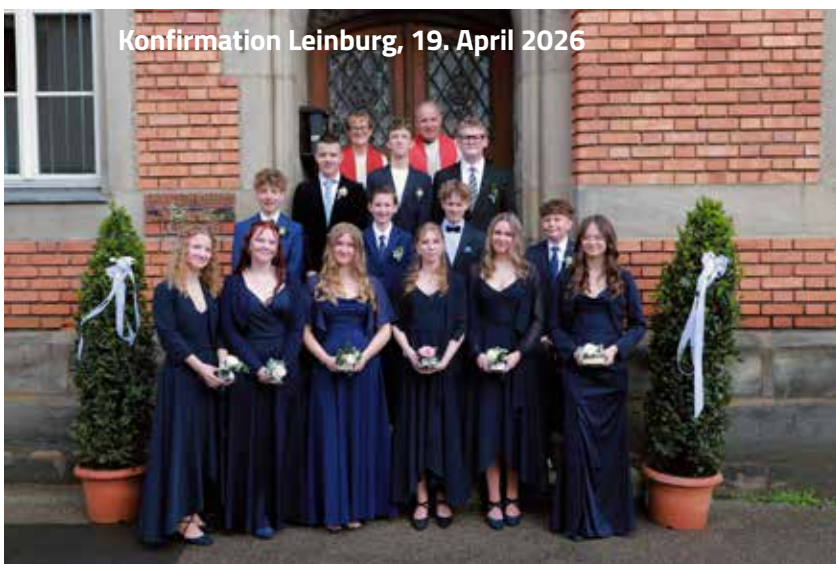
Konfirmation Leinburg, 19. April 2026

Es ist immer wieder etwas Besonderes, wenn die Konfirmanden, begleitet von unseren Posaunenchor in unsere Kirchen St. Peter und Paul und St. Leonhard einziehen. Staatsgästen gleich betreten sie den roten Teppich. Die Gemeinde erhebt sich, stolze Blicke - zu Recht!