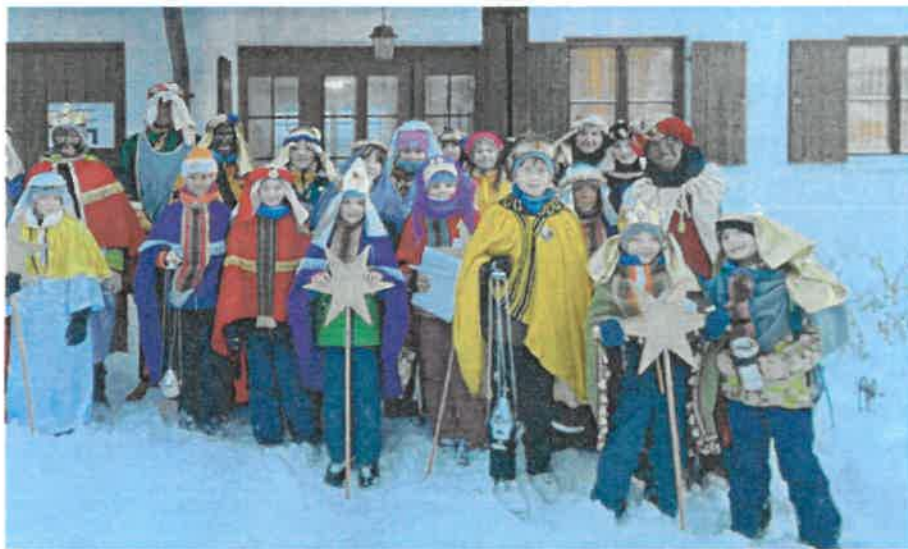
„St. Johannes Baptist“ – Thalkirchdorf