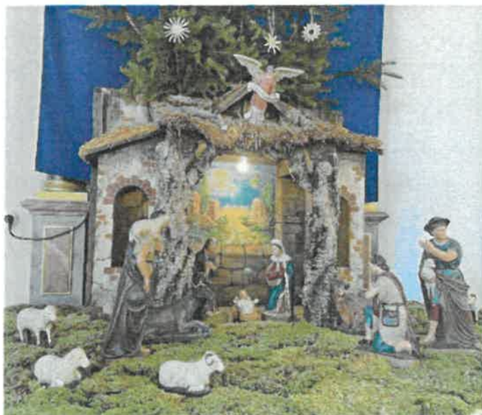
„Maria Schnee“ Aach