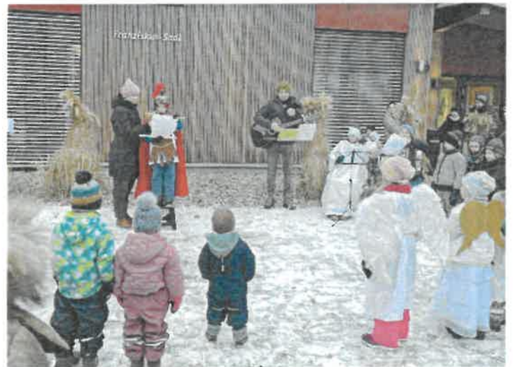
„St. Peter und Paul“ Oberstauten Krippengang im Freien