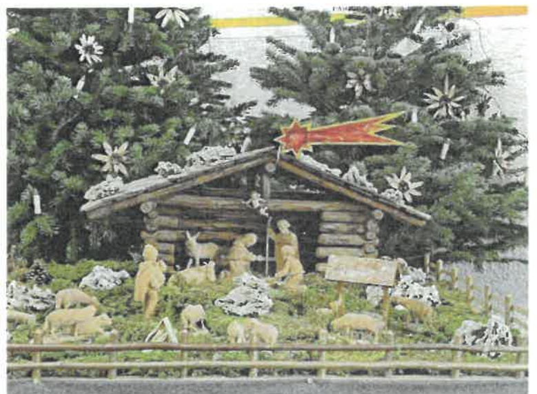
„Verklärung Christi“ Steibis