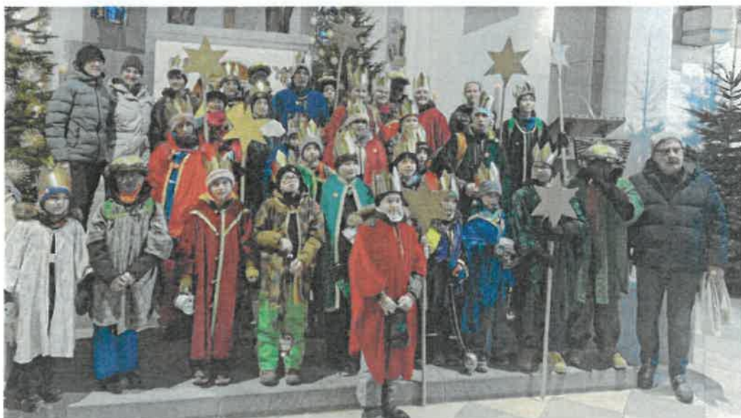
„St. Peter und Paul“ - Oberstaufen