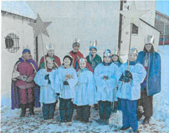
„Maria Schnee“ - Aach