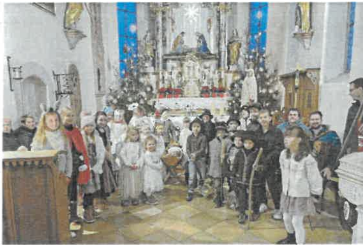
„St. Johannes Baptist“- Thalkirchdorf