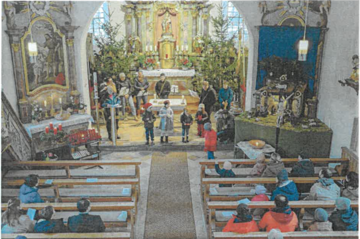
"Dra'mer Familienweihnacht" in Aach