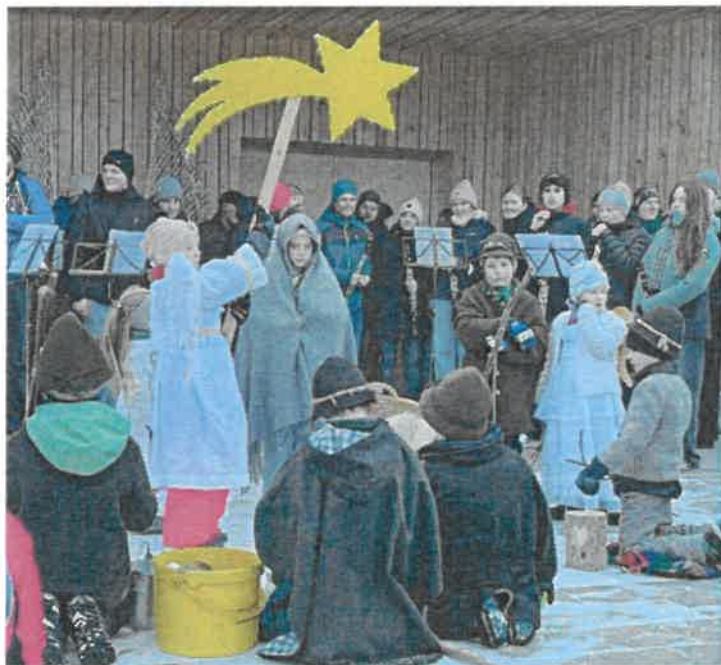
„Verklärung Christi“- Steibis