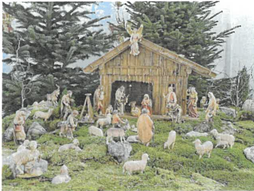
„St. Peter und Paul“ Oberstaußen