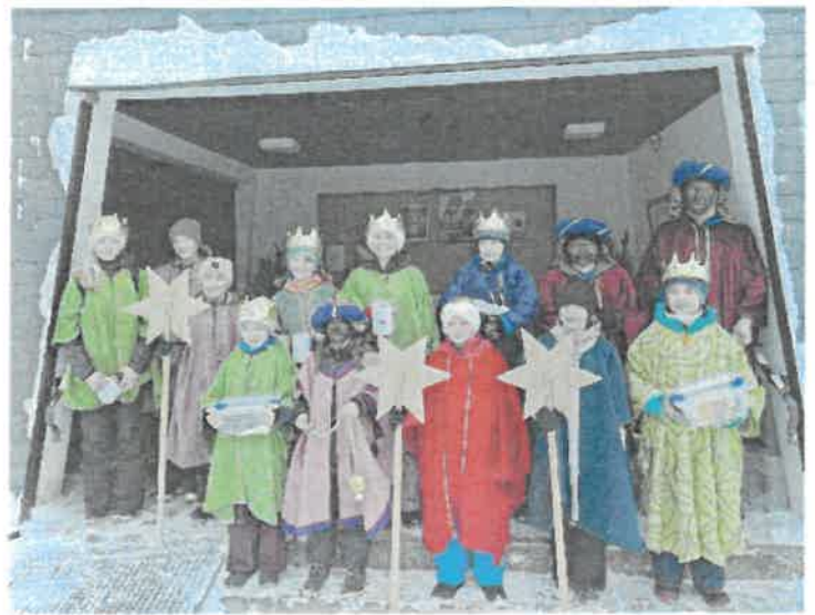
„Verklärung Christi“ – Steibis