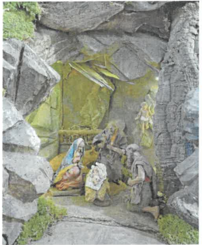
„St. Johannes Baptist“ Thalkirchdorf