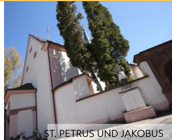
ST. PETRUS UND JAKOBUS

Bogenstr. 2, Tel. Anmeldung 60 47 info@tut.psychberatungsstelle.de Mo. - Fr. 8.30 - 11.30 Uhr und 14.00 - 17.00 Uhr