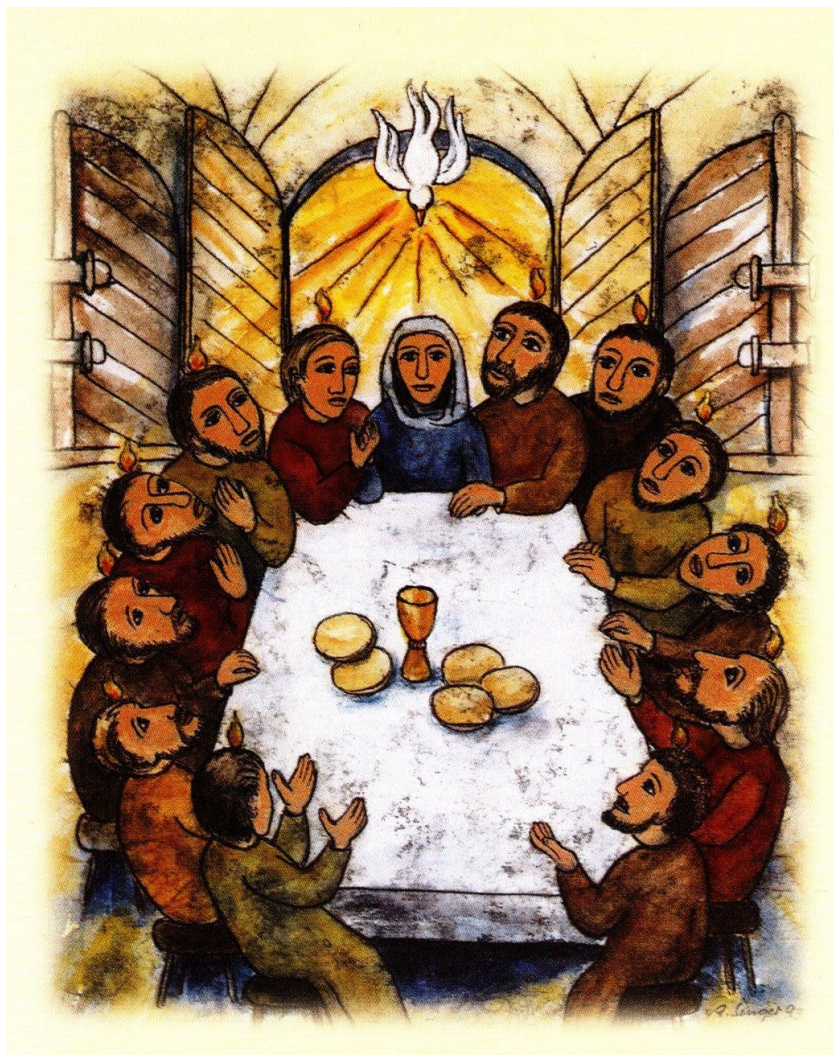
Pfingsten, colorierte Monotypie auf Japanpapier