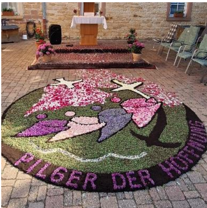
Ludwigsstift Edenkoben 2025

Burrweiler, Edenkoben, Edesheim, Flemlingen mit Böchingen, Gleisweiler mit Frankweiler, Hainfeld mit Rhodt, Roschbach mit Walsheim, Sankt Martin und Weyher