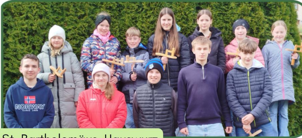
St. Bartholomäus, Hauswurz

Wenn in der Abendmahlsfeier die Orgel verstummt, verstummen auch die Glocken. Da wurden auch in diesem Jahr unsere Messdiener aus Hauswurz und Rommerz aktiv. Mit Klappern ging es durch die Straßen.