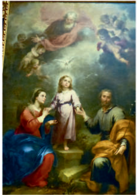
Grafik: Bartolomé Esteban Murillo, Die himmlische und irdische Dreifaltigkeit (1675–1682)