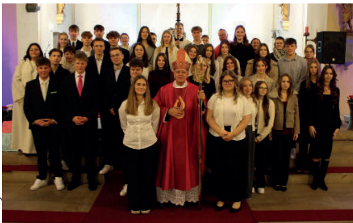
Firmfeier in Velmede

In diesem Jahr haben wir in unserem Pastoralen Raum am Wochenende vom 21. –22. November drei Firmfeiern begangen. Zum ersten Mal wurde dabei das neue Firmkonzept umgesetzt. Ein wesentlicher Bestandteil darin ist, dass die Jugendlichen selbst entscheiden dürfen, in welcher Kirchengemeinde sie zur Firmung gehen möchten. So entstanden folgende Firmtermine am Freitag,