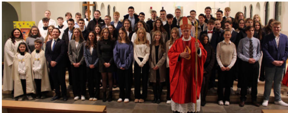
Firmfeier in Meschede (15 Uhr)

nach Vergebung streben, so kann man dem Leben wieder eine Segnung geben.