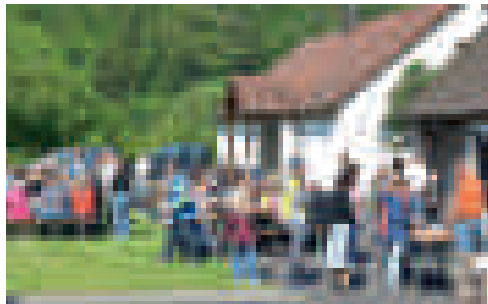
(Text: S. Köhler)