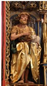
St. Valentin, Johannsaltar

Herzliche Einladung Mittwoch, 24. Juni 2026, 18.00 Uhr,Kirche St. Valentin